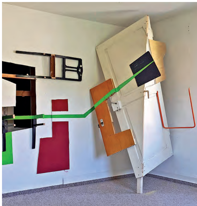
Tür, Stuhl und Farbe